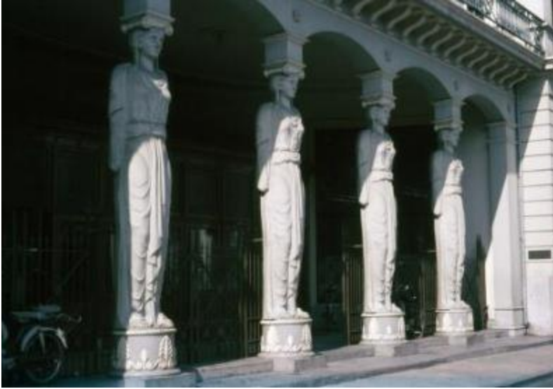
Figuur 2. P. Adams, Kariatiden Winkel van Sinkel, 800609, Oudegracht 158, Utrecht.