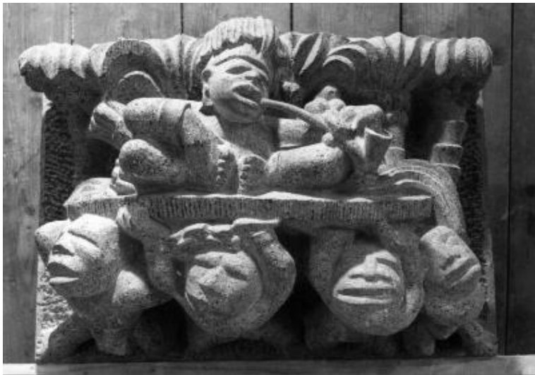
Figuur 1. J. Bürgi, Console van De Moriaan, 66386, hardsteen, Oudegracht 18, Utrecht.

Voor een kunstenaar is het lastig om maatschappelijke bewustwording over het slavernijverleden te creëren. Het tonen van de kunst is niet genoeg om de maatschappij aan het denken te zetten. Voorbijgangers gaan de kunst dan puur als kunst zien of als zomaar een mening van de kunstenaar. Door op een actieve manier het bewustzijn over slavernij te creëren komt de kunstenaar al dichterbij het overtreffen van de ‘muur’. In Utrecht kunnen er wandelroutes langs de kunstwerken georganiseerd worden. Door de wandeling en de informatie van de gids kan men bewust worden over het slavernijverleden van Utrecht. Door grenzen op te zoeken en een eigenzinnige toevoeging te bieden kan de kunstenaar zich proberen te onderscheiden van de maatschappij.